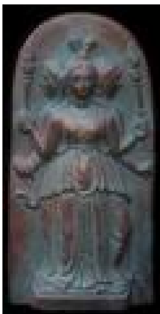
Фигура с жертвенника Гекаты