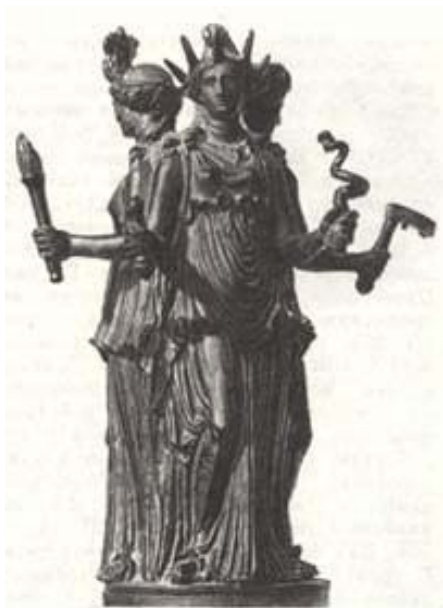
Скульптурная группа «Геката».

животные-ипостаси: кобыла, собака, лев; число: 3.